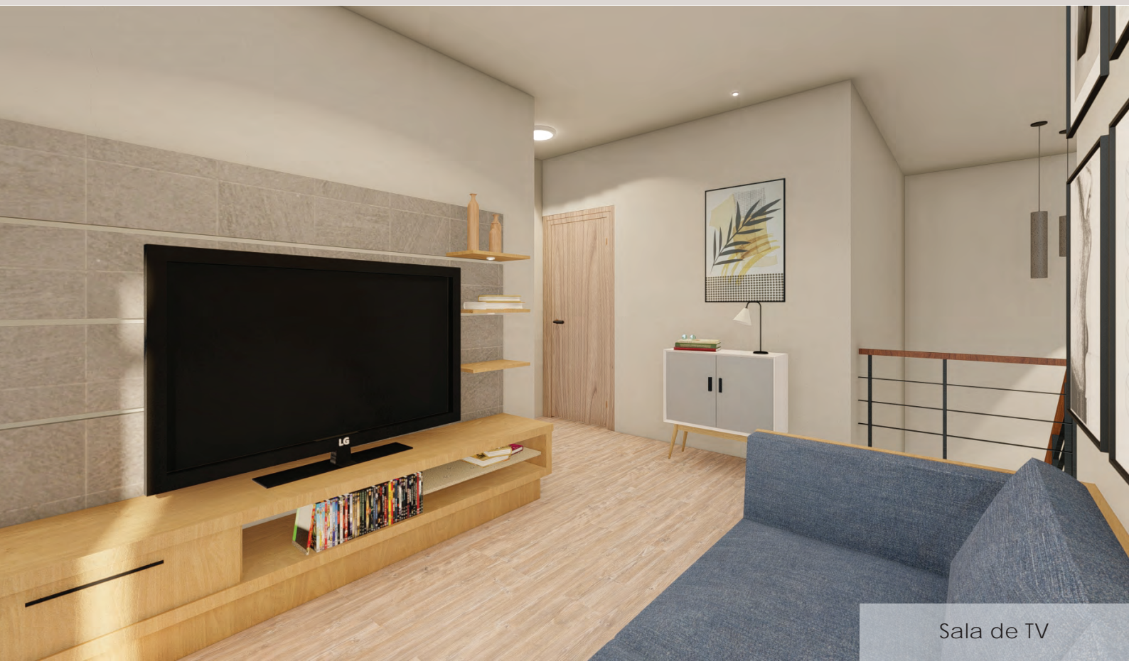
Sala de TV