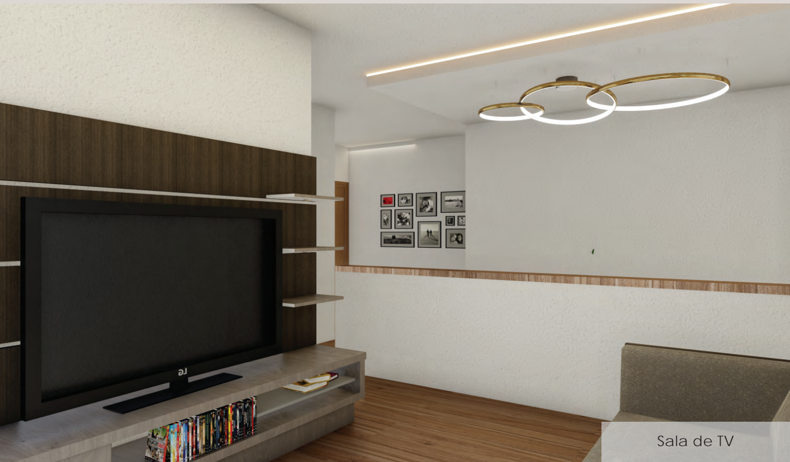
Sala de TV