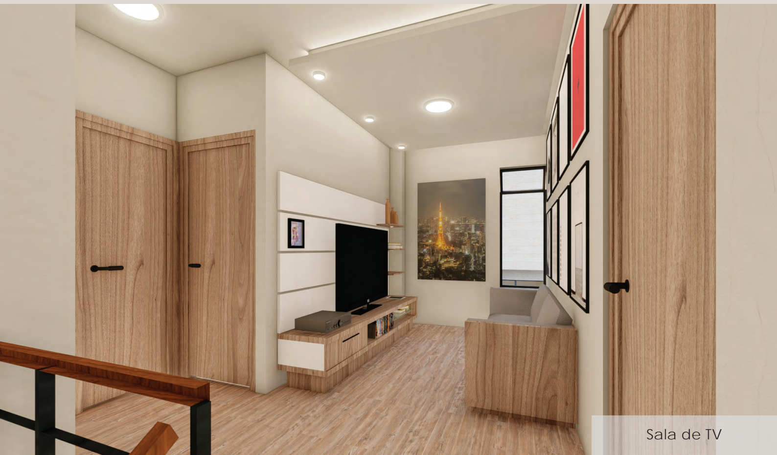
Sala de TV