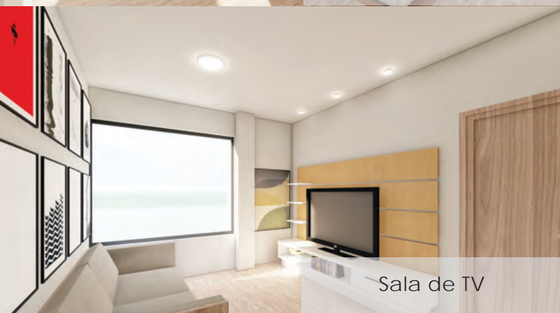
Sala de TV